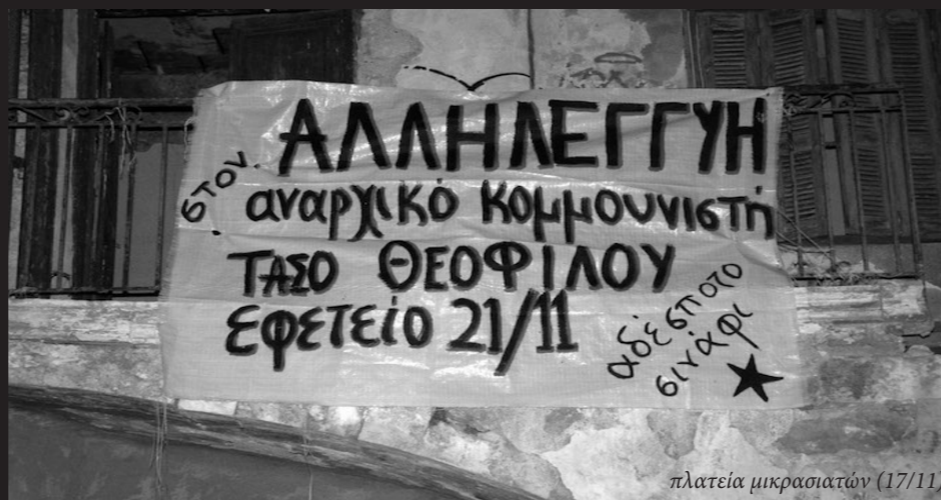
πλατεία μικρασιατών (17/11)

• Οι έγκλειστοι στο κέντρο κράτησης μεταναστών του αλούτσε στη μαδρίτη (18/10) εξεγέρθηκαν ανεβαίνοντας στις ταρατσες φωνάζοντας "Πευτεριά", ενώ αλληλεγγυοί τους εμπύχωναν απ' έξω.